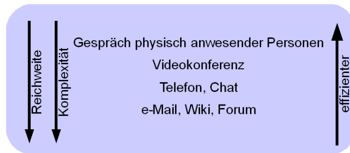
Abbildung 1: Zusammenhang von Effizienz und Technischen Voraussetzungen in Kommunikationskanälen.

der Wissensaustausch. Andererseits steigt mit zunehmender technischer Komplexität die Reichweite und Anzahl potentiell erreichbarer Personen. Ein WM-System ist nun eine beliebige Kombination der einzelnen Technologien, welche die Wissenserfassung, -Integration, -Speicherung und -Verwaltung zur Aufgabe hat. Gleichzeitig erlauben sie Kommunikation zwischen räumlich bzw. zeitlich getrennten Mitarbeitern, was dem Wissensaufbau und Wissenserwerb zu Gute kommt ([Fre03], S.11).